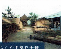
ふくやま草戸千軒 ミュージアム