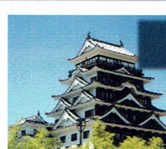
福山城 (北面鉄板張)