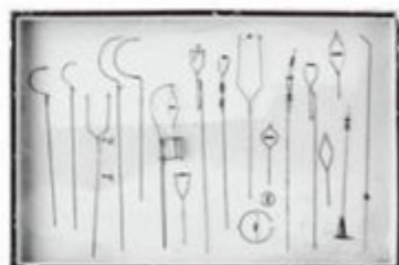
模型気流風洞実験風向指標試作